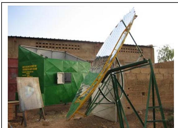
La cuisine pour la fabrication de beurre de karité. La parabole est devant la maison (cuisine), les rayons solaires sont envoyés et focalisés à la petite fenêtre.