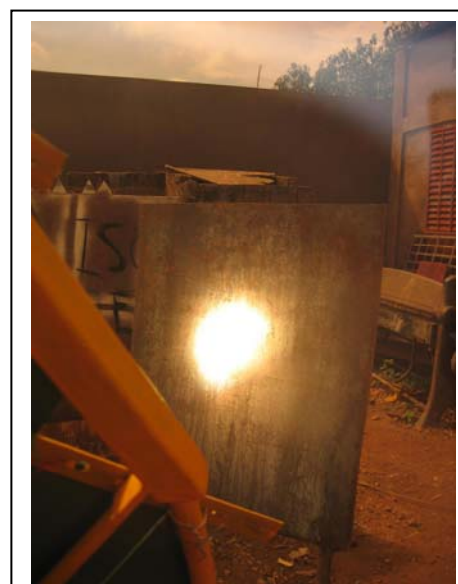
Les miroirs sur la parabole sont attachés soigneusement, le diamètre du point focal est circa 20 cm.