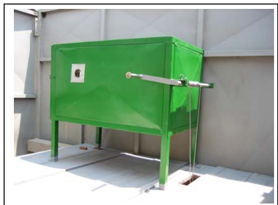
La cuisinière hybride. Elle est posée dans la cuisine, just derrière la fenêtre pour le passage de lumière. A droit, on peut voir la manivelle.