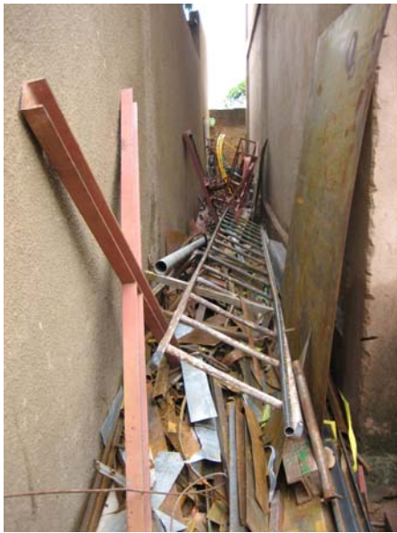
Comment on est habitué à « ranger » des matériaux, surtout des morceaux coupés.