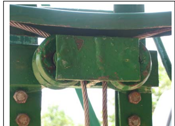
A gauche on peut bien voir le Réflecteur secondaire, ici en test (préparation de la sauce Yassa et riz). En haut, les bobines du Tracking system qui dirigent les câbles de la manivelle sont à voir.