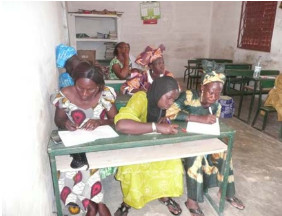
Schulung der Frauen in Malicounda