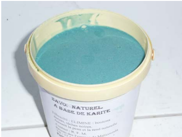
Das erste Produkt: Karite-Seife im Topf (Shea Butter)