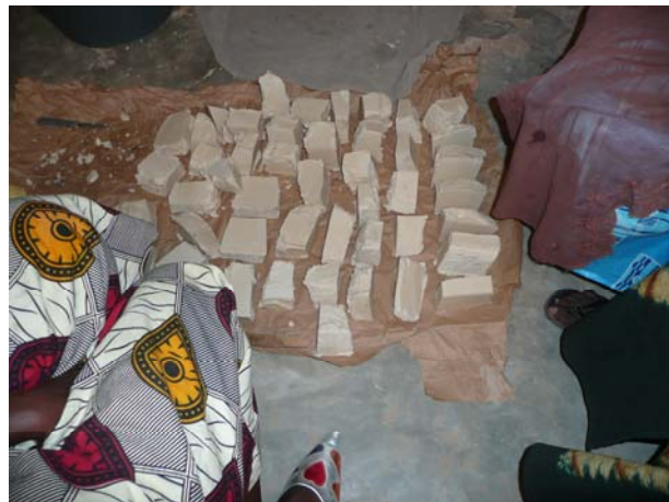
Erste Seifenstücke – zum Verkauf im Dorf