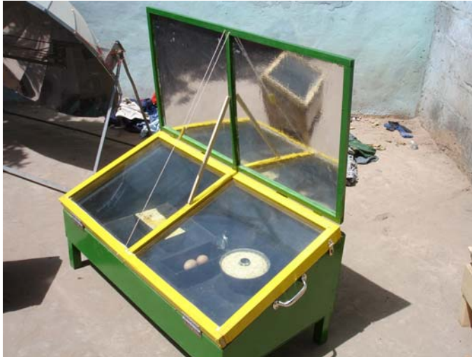
Vorführung der Solarkocher im Schulhof

Hier wird der Kocher im Schulhof der neuen Schule in Malicounda aufgestellt und natürlich allseits beguckt und bewundert- besonders die Mütter kommen, um diesen seltsamen Ofen mit einer Mischung aus Skepsis und Neugierde zu bestaunen: jetzt werden wieder Kuchen gebacken und mit Genuss gegessen, dann verteilt und später auch verkauft.